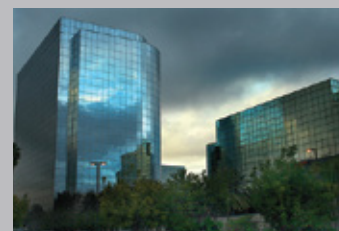
Edifícios industriais e de habitação